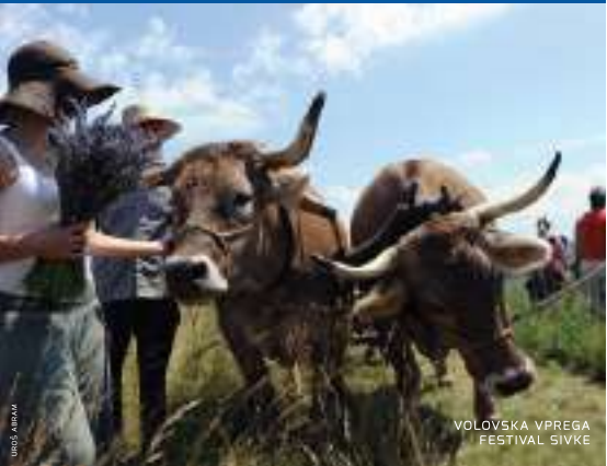
VOLOVSKA VPREGA FESTIVAL SIVKE