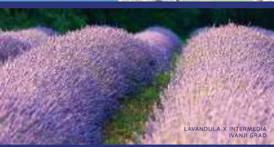
LAVANDULA X INTERMEDIA IVANJI GRAD